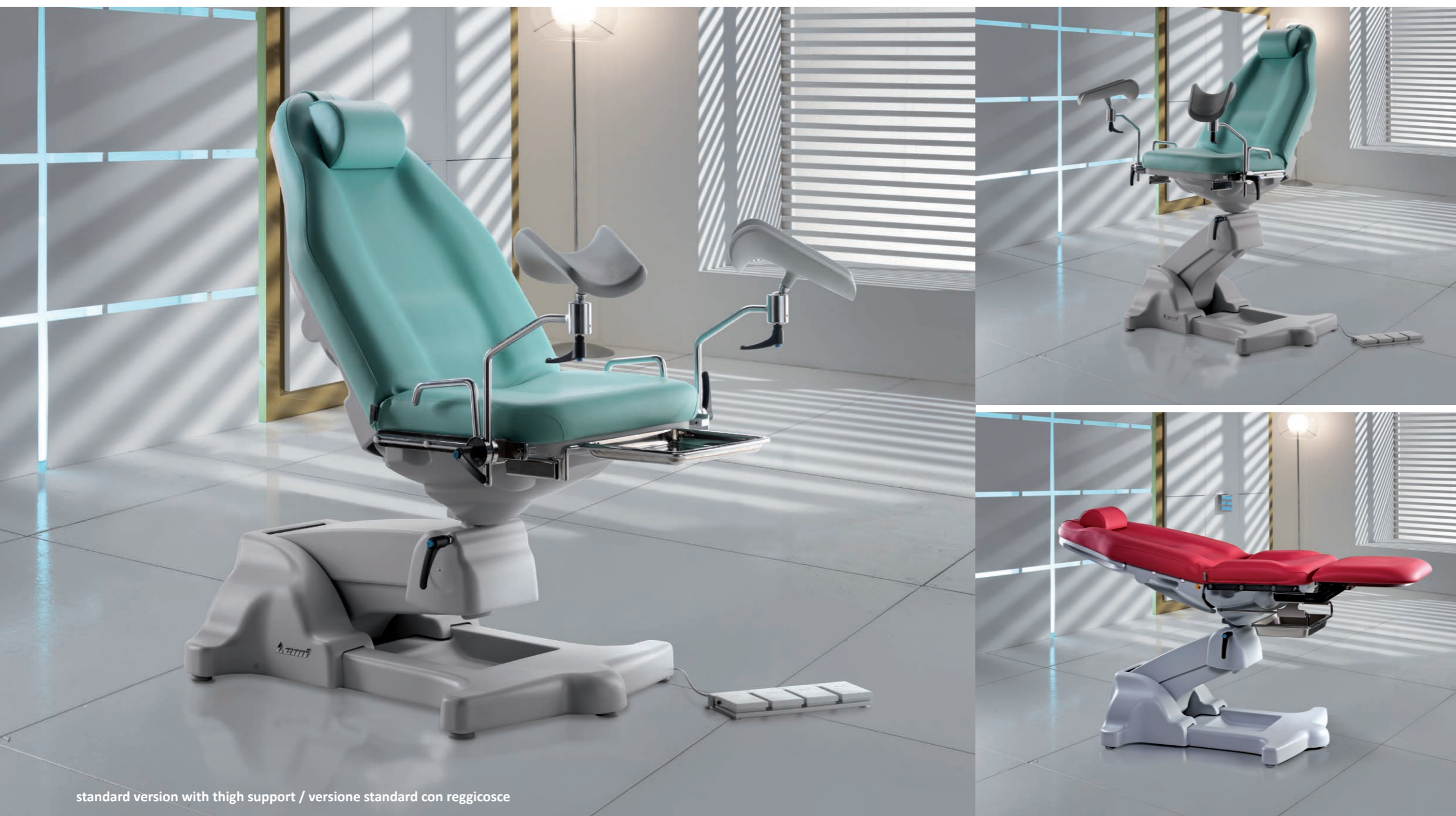
standard version with thigh support / versione standard con reggicosce